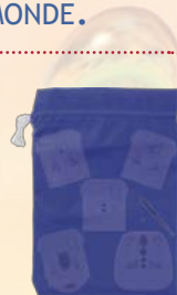
SAC POUR LES ADAPTATEURS