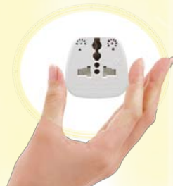
BASE INTERNATIONALE POUVANT RECEVOIR LA QUASI-TOTALITÉ DES CORDONS SECTEURS.