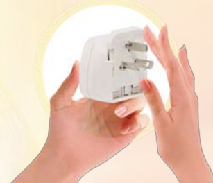
MODULE S'INSÉRANT DANS LA BASE INTERNATIONALE POUR RÉALISER L'ADAPTATEUR DÉSIRÉ.