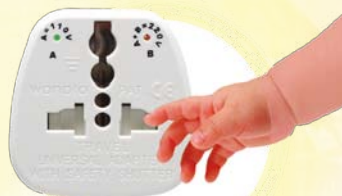
BASE INTERNATIONALE ÉQUIPÉE DE LA «PROTECTION ENFANT» PAR L'INSERTION DE DEUX CLIPS.