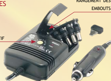
CARACTÉRISTIQUES DES EMBOUTS